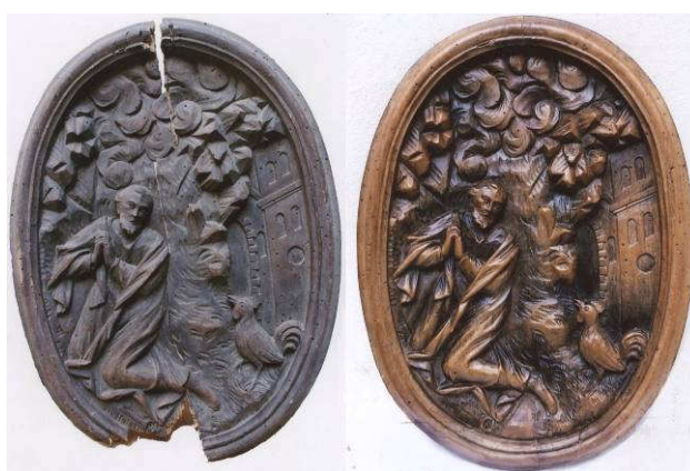
Restaurované předměty před a po zásahu: dřevořezba Sv. Václav (př. č. 273/79), dřevěný reliéf (př. č. 1209/80), Bible kralická, II. díl (C1 30)