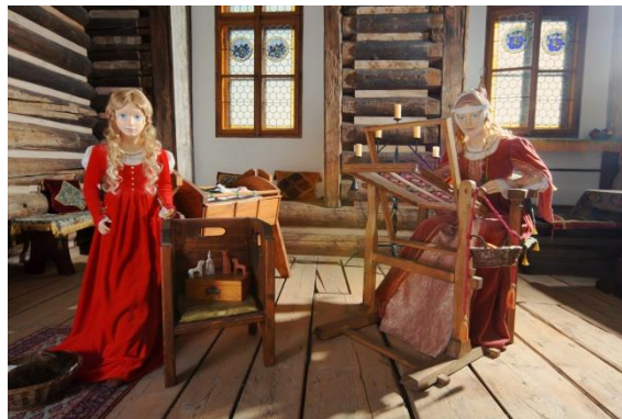
Hrádek - Smíškova komnata

Historická technologie dobývání a zpracování stříbra – Dílo havířské, těžní stroj trejv, středověké důlní dílo, Havířská osada a Verk čili Dílo mincovní