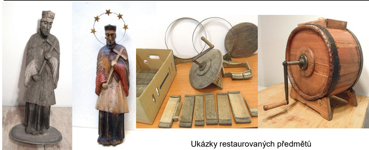
Ukázky restaurovaných předmětů