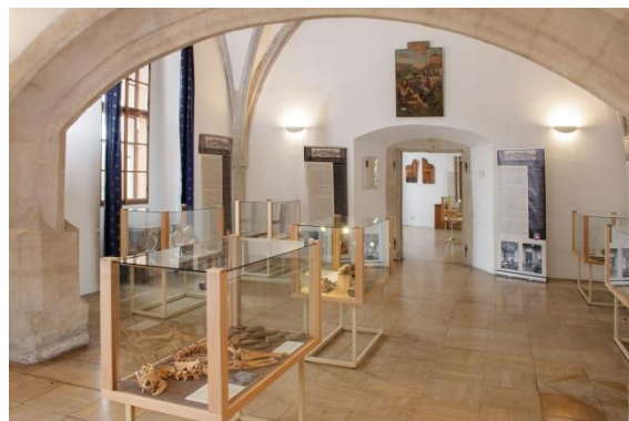
Příběhy z muzejních sbírek