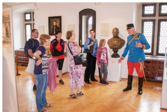
Návrat do dob císaře pána