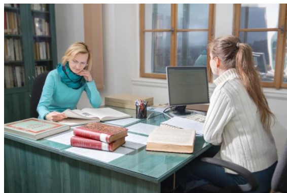
Badatelna knihovny ČMS