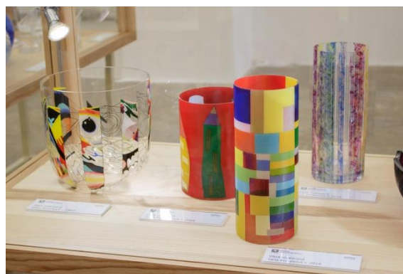
Sklo a světlo

Praha – Strahovský klášter, 20. prosince až květen 2018 pořádá Česká numismatická společnost a Královská kanonie premonstrátů na Strahově spolupráce za ČMS: Petrář