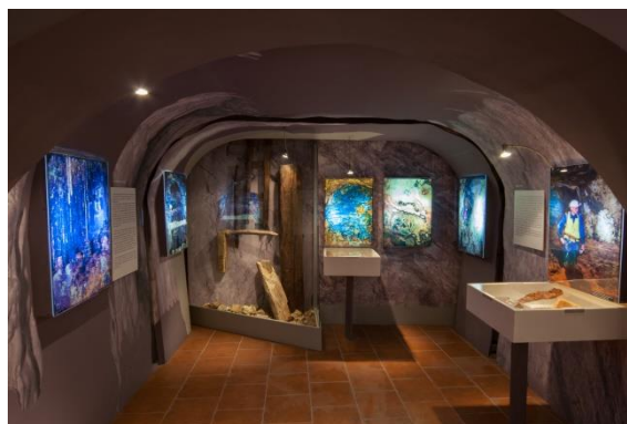
Tylův dům - podzemí Kutné Hory

Prezentace speleologického průzkumu starých důlních děl v Kutné Hoře