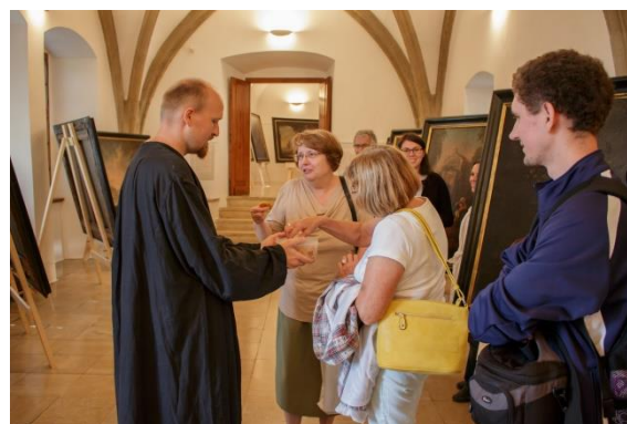
Baroko všemi smysly