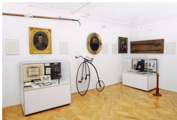
Kamenný dům - Spolková činnost

Kamenné plastiky a architektonické články z nejvýznamnějších gotických památek města