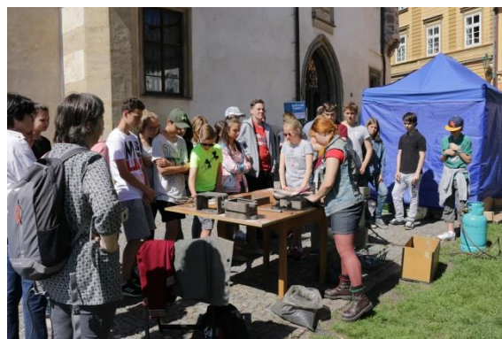
Řemesla pro ZŠ