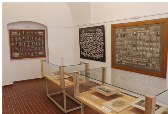
Najdi si svého pradědečka