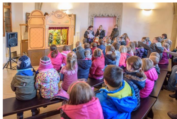
Advent na Hrádku