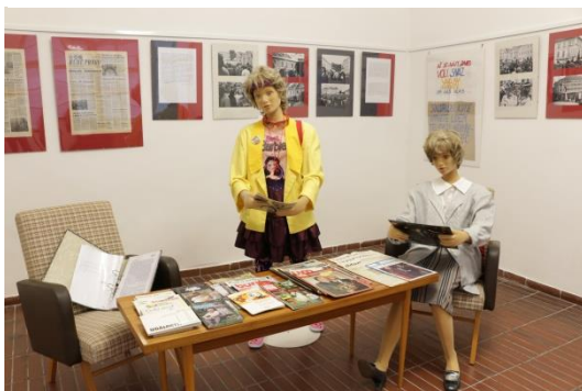
Kutná Hora sametová