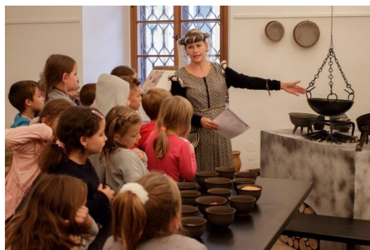
Václav IV. a jeho doba