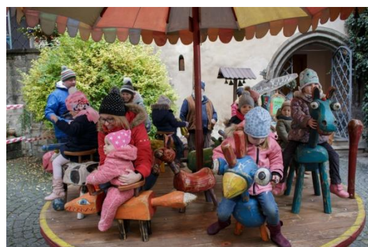
Advent na Hrádku

Den Středočeského kraje, 28. 10. 2019 4 536 vstupů (Hrádek – 2 969 vstupů, Kamenný dům – 962 vstupů, Tylův dům – 605 vstupů) - z toho Burza knih: 612 návštěvníků