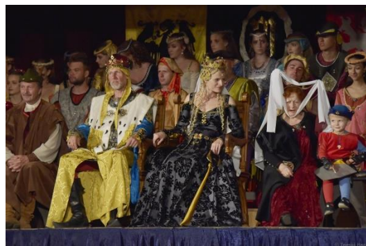
Královské stříbření Kutné Hory

Kutnohorské léto, červenec až srpen, 97 návštěvníků - doprovodný edukační program Václav IV. – král ve stínu svého otce - Vavrušková: 4 skupiny – 35 návštěvníků - Jurusová: 3 skupiny – 62 návštěvníků