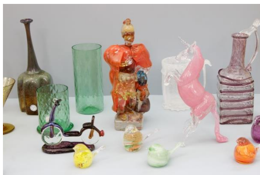
Kouzlo sklářského řemesla