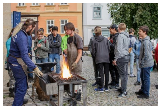
Řemesla pro ZŠ