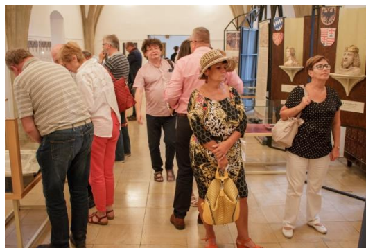
Václav IV. – král ve stínu svého otce

Bible a mince Praha – Strahovský klášter, 17. dubna až 26. června - spoluautor: Petrář