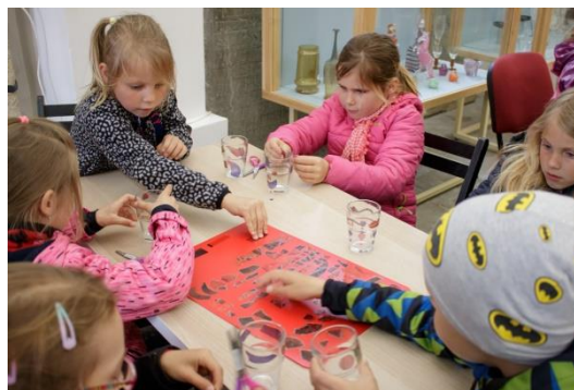
Hrátky se sklem