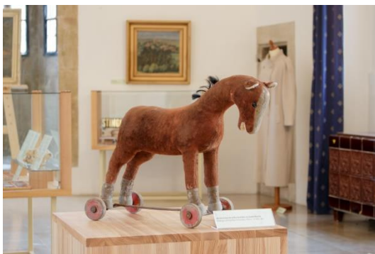
Co nového v muzeu

- autoři: Entlerová, Jurusová, Kolečková Veselá, Králová, Kremla, Vavrušková