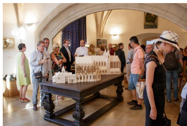
Vernisáž výstavy Stavitelé katedrál