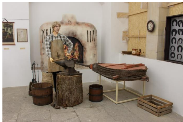
Výstava Černé řemeslo

- výstava převzatá od České numismatické společnosti