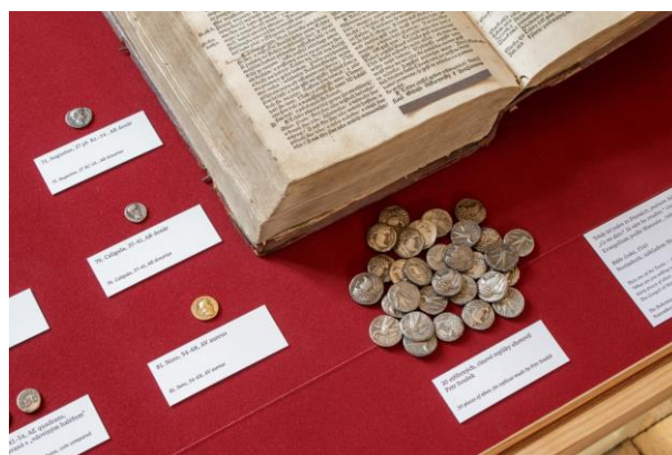
Výstava Bible a mince