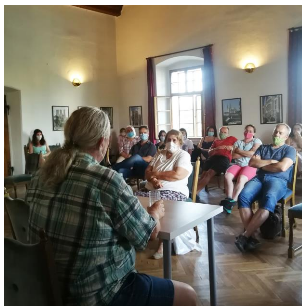
Přednáška Ze Sedlce do Kutné Hory a zpět

Výročí zaražení prvních šlikovských tolarů , ČNS Cheb, 17. 3. – 45 posluchačů Rod Schliků a počátky jejich mincovnictví , videokonference pro členy ČNS, 13. 5.