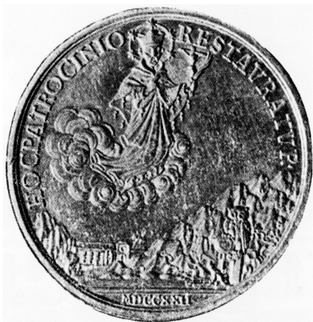
Zlatá výtěžková medaile z roku 1722 z jílovského zlata s námětem sv. Jana Nepomuckého se značkou sovy vpravo na skále pod vznášející se postavou světce, průměr 47 mm

Za výtěžkovou minci bývá také někdy považován známý „příbramský zlatník“ císaře Františka Josefa I. (1848-1916). Zde se však spíše jedná o minci pamětní, raženou sice z příbramského stříbra, ale u příležitosti tehdejšího důlního rekordu – poprvé na světě dosažené kolmé hloubky 1000 metrů na dole Sv. Vojtěch v Březových Horách u Příbrami v roce 1875. 10