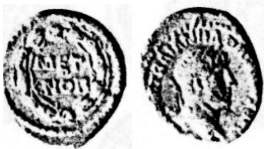
Římská měděná mince císaře Hadriana s nápisem MET NOR (metallum noricum - z kovu dolů starověkého Norika), průměr 18 mm

Tento významný český numismatik ve své studii o výtěžkových mincích také upozornil, že již některé starověké ražby mají podobný charakter, přestože to na nich není přímo označeno, pouze uvedené jméno mincovního místa je totožné s doly totožné lokality. Příkladem jsou statéry Filipa II. ze zlata severovýchodního Řecka nebo mince z počátků římského císařství ze stříbra hispánských dolů. 2 Původ mincovního kovu je poprvé vyznačen na drobných měděných ražbách římských císařů Traiana (98-117) a Hadriana (117-138) jako METALLI VLPIANI DELM, MET NOR, METAL DELM, METALLI PANNONICI, DARDANICI a další. 3