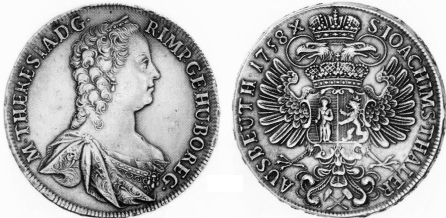
Výtěžkový tolar Marie Terezie z jáchymovského stříbra ražený v pražské mincovně roku 1758, stříbro, průměr 41 mm

z let 1717 a 1718 a Marie Terezie (1740-1780) s ročníky 1758 a 1759, na jejichž rubu jsou přímo opisové texty S.IOACHIMBSTALISCHE AUSBEUT THALER nebo S.IOACHIMS.THALER AUSBEUTH - svatojáchymovský výtěžkový tolar. 7