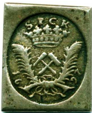
Jednostranná výtěžková klipa s iniciálami kutnohorského mincmistra Kryštofa Kraheho z roku 1697, rozměry 13 x 16 mm

Po roce 1700 však těžba dále dramaticky poklesla. V této době pracovalo na Turkaňském, Rejském a Hloušeckém pásmu asi 50 - 80 havřů a důlní produkce obnášela 400 - 600 tun kyzů s obsahem 200 - 300 kg stříbra ročně.