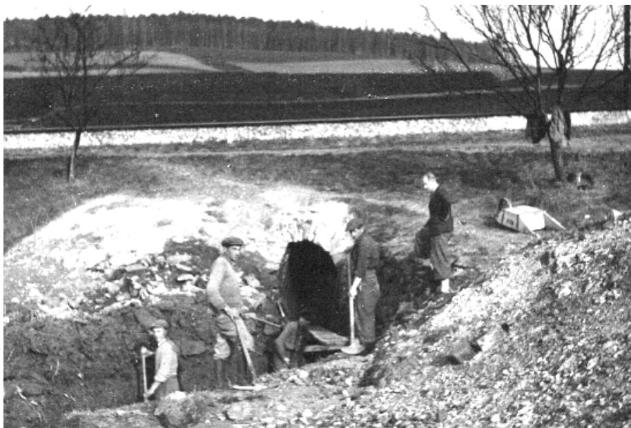
Zahájení prací na štole „Čtrnácti pomocníků“ na počátku 80. let 19. století