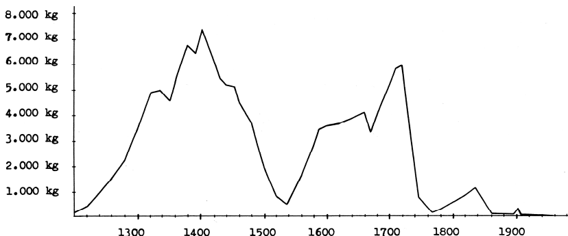
Produkce stříbra v kutnohorských dolech v časovém horizontu podle F. Oraského

Počátky kutnohorského dolování sahají do poslední čtvrtiny 13. století a produkce těžby stříbra zaznamenala dva vrcholy - první na přelomu 14. a 15. století za vlády Václava IV., kdy kutnohorské doly dodávaly celou třetinu evropského stříbra vůbec, a druhý za panování Vladislava Jagellonského ve druhé polovině 15. století.