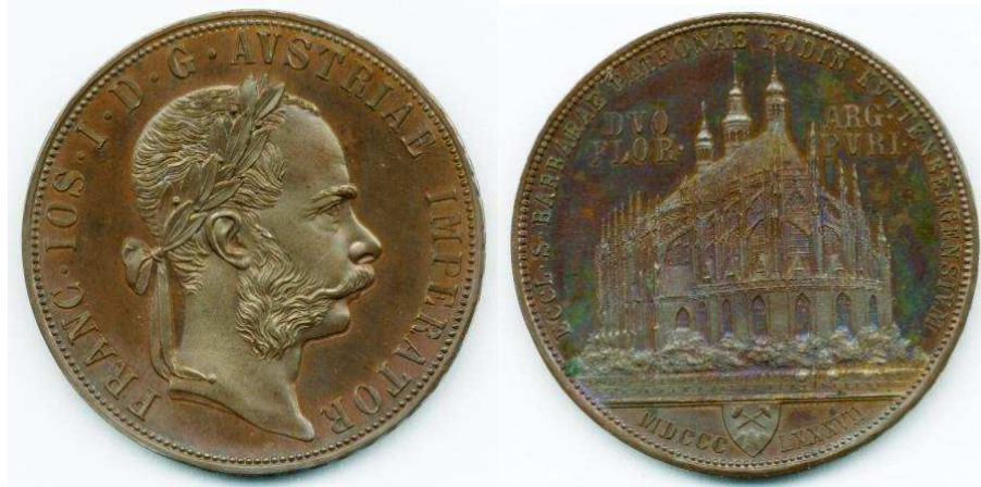
Zkušební měděný odražek Kutnohorského dvouzlatníku, 36 mm

V numismatické sbírce Českého muzea stříbra se nachází mimo několika exemplářů stříbrného Kutnohorského dvouzlatníku i zkušební měděný odražek této vzácné ražby.