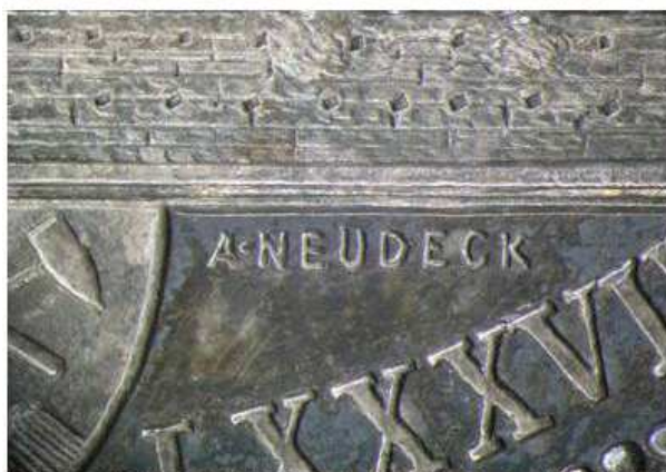
Rozdíly ve stejném detailu na cínovém odražku, měděné zkoušce a originálním stříbrném Kutnohorském dvouzlatníku