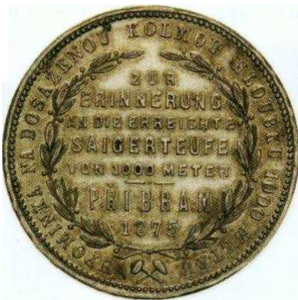
Tzv. příbramský zlatník na paměť dosažení kolmé hloubky 1000 m poprvé na světě na dolu sv. Vojtěch v Březových horách u Příbrami, stříbro, průměr 29 mm