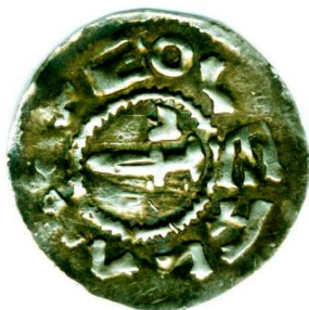
Líc tzv. mečového typu denáru Boleslava II. se záhadným znakem nad mečem považovaným za minciřské náčiní (kovadlina), stříbro, průměr 19 mm

Grošové období vrcholného a pozdního středověku vyloženě výtěžkové ražby nezná, pouze drobná stříbrná městská mince slezského města Bytomi z 15. století s vyobrazením kutajícího havíře má jistě souvislost s významnými středověkými doly v nedalekých Tarnovských horách. 5