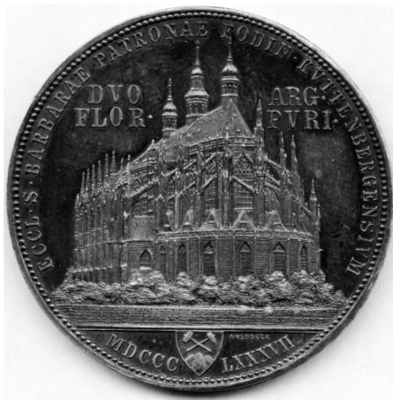
Kutnohorský dvouzlatník, stříbro, 36 mm

proběhl na městské radnici následujícího dne 8.5.1887, kde zazněla řada projevů, slavnostních zdavic a provolání: