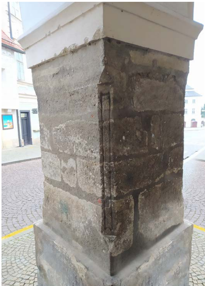
Sloup v podloubí na Palackého náměstí čp. 99