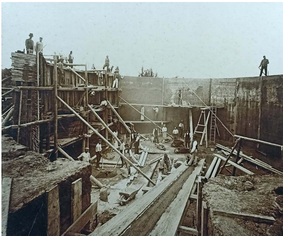
Stavba plynovodu

14. července 1893 Společenstvo výčepníků v Kutné Hoře žádá městskou radu o levnější tarif za m 3 plynu, s odvodněním, že právě hostinští jsou hlavními odběrateli plynu ve městě. A účtuje se jim 12 krejcarů za m 3 plynu oproti sou-