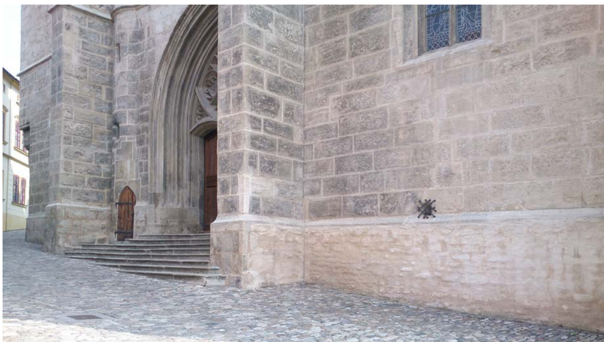
Výklenek krytý mřížkou v západním průčelí kostela sv. Jakuba