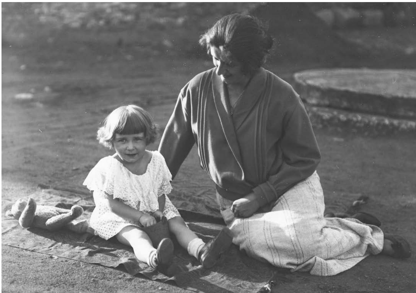
Dcera Jaromíra Pánková na dvoře plynárny