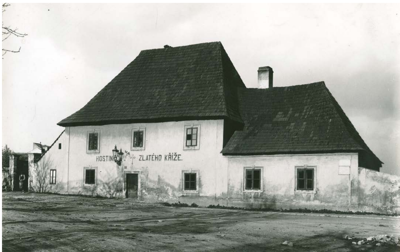
Hostinec U Zlatého kříže, 1902, foto Josef Vokoun, fotoarchiv ČMS, evid. č. 63/86

Podnikový archiv Mincovne Kremnica, fond Mincovňa Kremnica (1328) 1630–2016, I. oddelenie, Prevádzkové knihy a denníky z roku 1933; II. odd., Technický a výrobný úsek, Kartotéka razidiel. Podnikový archiv Mincovne Kremnica, fond Mincovňa Kremnica (1328) 1630–2016, I. oddelenie, Spisy bežnej agendy, šk. 640, 641, spisy č. 3300, 3365 a 3789.