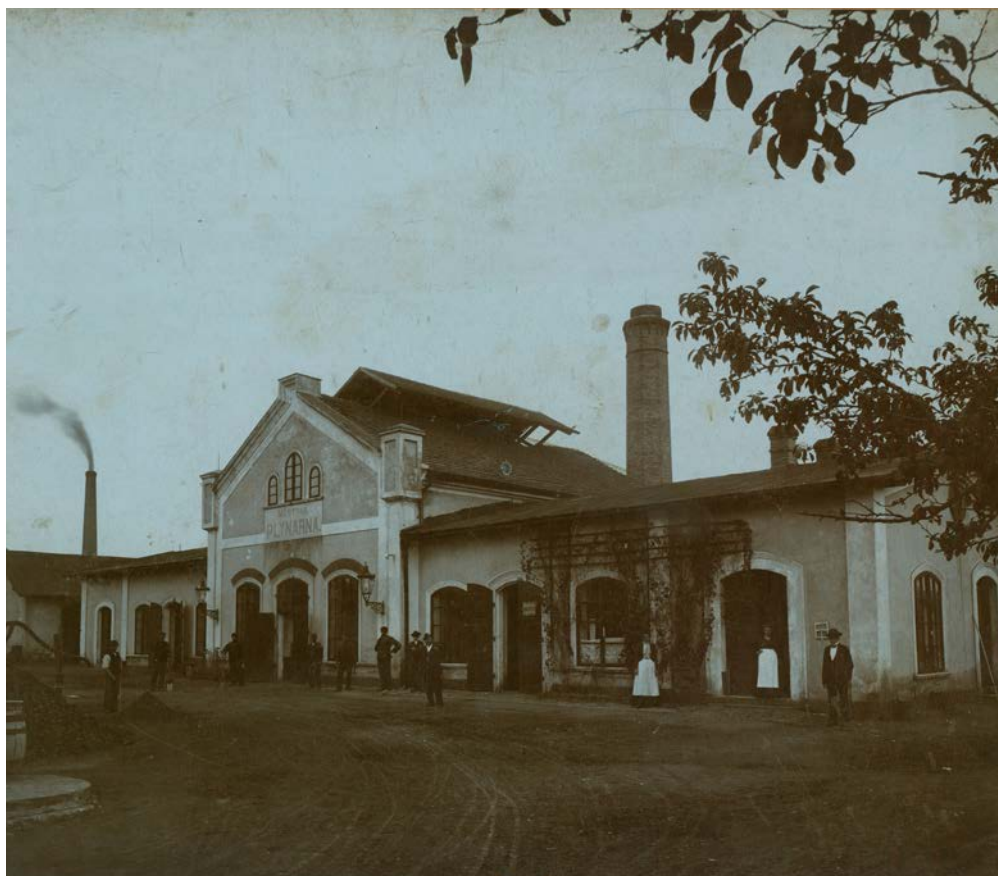
Fotografie městské plynárny

Se zavedením plynu v Kutné Hoře byla zároveň vybudována