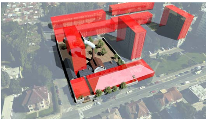
3D modely Městské plynárny i v dnešní zástavbě