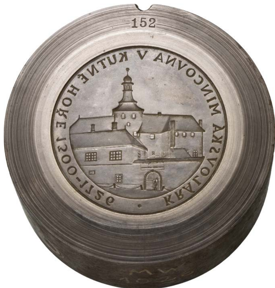
Matrice reversu – razidlo medaile použité k ražbě, ocel, Sbíрка ČMS, inv. č. M5/3